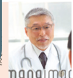
この文章は、レイアウトの雰囲気を見るための仮の文字です。