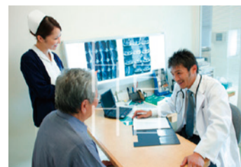
この文章は、レイアウトの雰囲気を見るための仮の文字です。

この文章は、レイアウトの雰囲気を見るための仮の文字です。実際の文章とは異なります。この本文は雰囲気を見るためのもので、本番はここに(実際の内容)が入ることになります。本文のアタリの文字を入れています。実際の内容とは関係ありません。例えば1月1日(祝)や12月25日など日付を入るとこのようになります。文字の量などを推量するために、アタリとしてダミーの文字を入れています。そのため